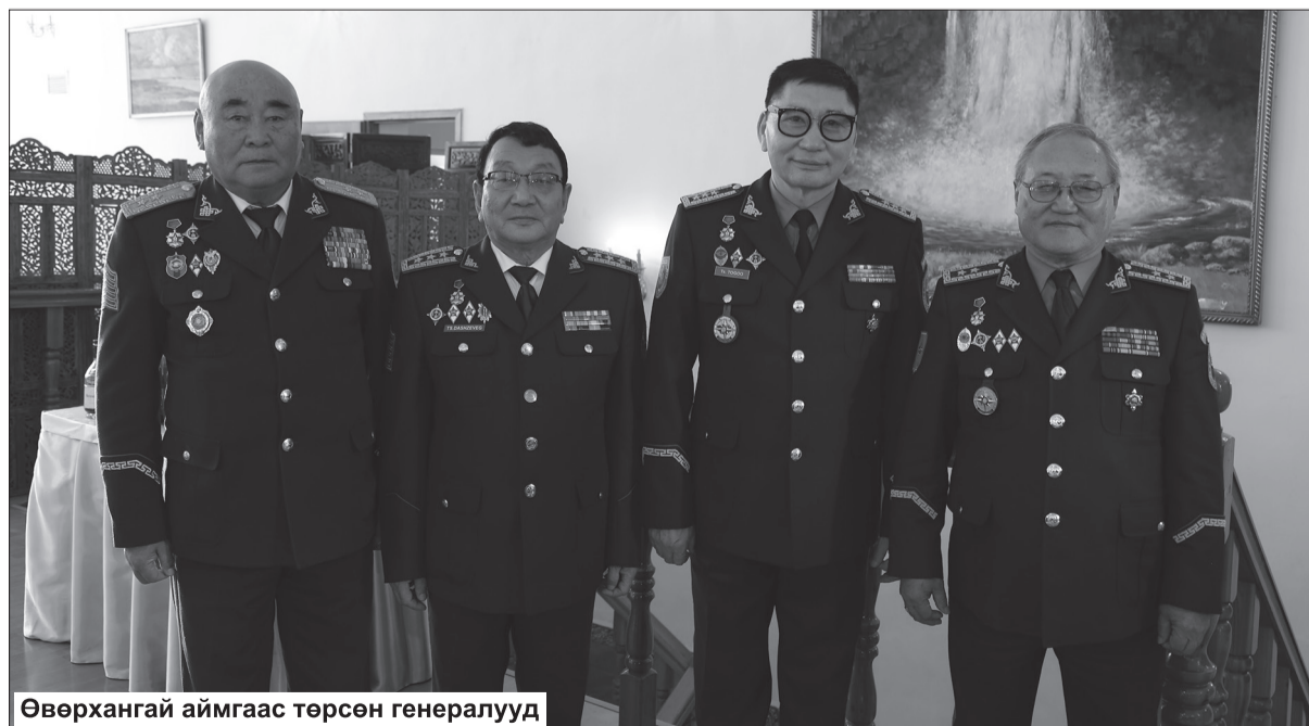
Өвөрхангай аймгаас төрсөн генералууд

газар төсөв байдаггүй. Тухайн үед 200 гаруй сая төгрөг болж байсан. Үүнийг нь бид Зэвсэгт хүчний урсгал зардлаа хойшлуулан байж шийдвэрлүүлж явах гарцаа гаргаж байлаа. Ингэж ажиллагаа