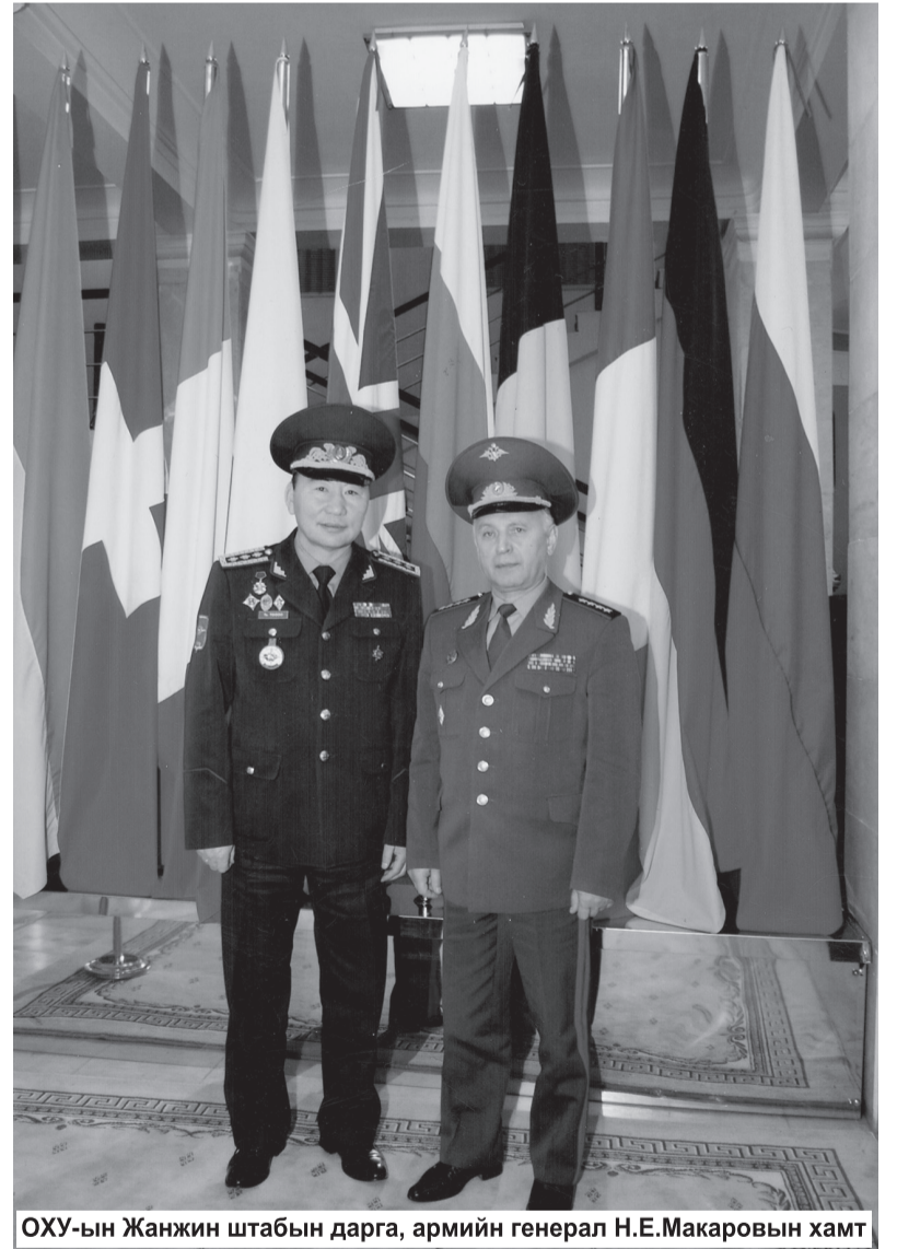
ОХУ-ын Жанжин штабын дарга, армийн генерал Н.Е.Макаровын хамт