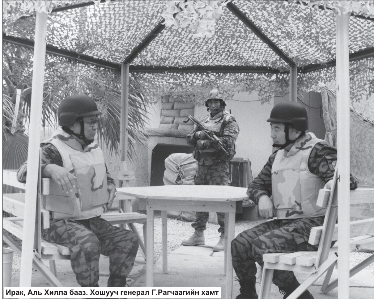
Ирак, Аль Хилла бааз. Хошууч генерал Г.Рагчаагийн хамт

Найм, есөн орны 2000 гаруй цэргийн алба хаагчдаас манай цэргүүд л цагийн байдалд дасан зохицож шаардлагатай арга хэмжээг авч, хийморь золбоотой, авхаалжтай үүрэг гүйцэтгэж байсан. Хүний газар нутгаа санасан цэргүүд, тэднийгээ санасан дарга бид хэд яг л аав, хүү шиг уулзалдаж байлаа. Энэ цаг мөч бол миний амьдралд төдийгүй Монгол Улсын Зэвсэгт хүчинд мартагдашгүй цаг үе болж үлдсэн. Үүний дараа бид НҮБ-ын сонгомол ажиллагаанд явах эрхтэй болсон. Сьерра Леоны ажиллагаанд явах мандатаа авчихаад байдаг. Гэтэл Засгийн