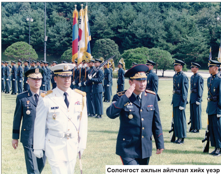
Солонгост ажлын айлчлал хийх үеэр

Эх орноо батлан хамгаалах нэр хүндтэй, ариун үйлсэд хүчин зүтгээд тэтгэвэр чөлөөнд гарсан эрхэм хүндэт ахмадууд Та бүхэндээ учран золгож буй "Цөөвөр" хэмээх Улаагчин үхэр жилийн сар шинийн мэндийг өргөн дэвшүүлж, энх тунх, түвшин жаргалтай байхын өлзий төгс ерөөлийг айлтгая.