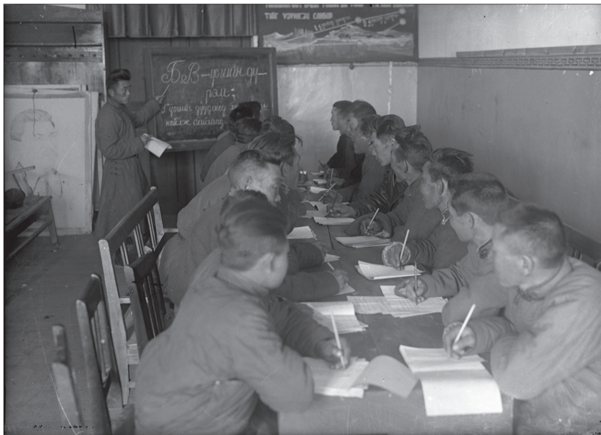
Шинэ үсэгт суралцаж буй хүмүүс. 1940-өөд оны сүүл.

1969 оны хүн амын тоо бүртгэлийн мэдээгээр нийт хүн амын 82.4 хувь нь бичгийн боловсролтой болсны дотор эрэгтэйчүүдийн 88.7, эмэгтэйчүүдийн 76.6 хувь нь бичигтэн болсон байлаа.