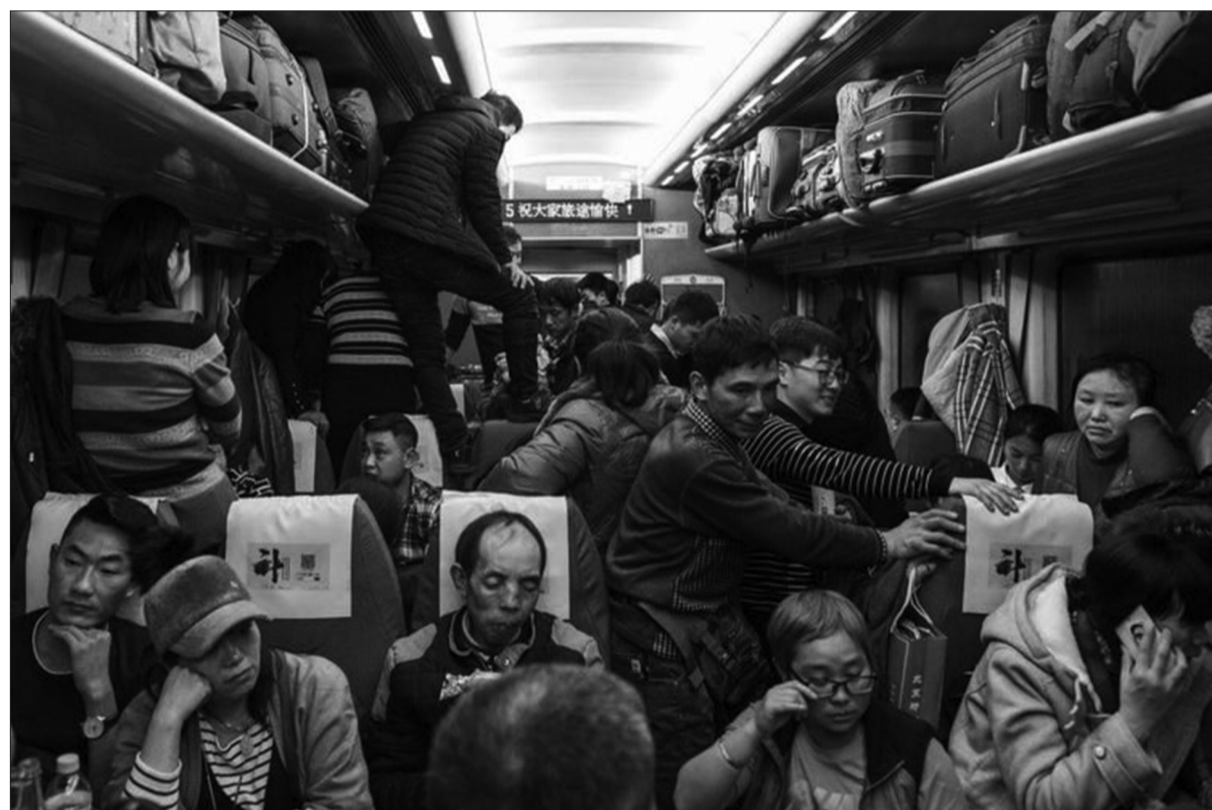
Цагаан сарын баяраар гэртээ харихаар 400 гаруй сая Хятад хүн замд гардаг

Дэлхий даяар зочид буудал, зоогийн газар, нисэхийн салбар зэрэг уламжлалт аналогид технологид тулгуурласан